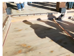
表舞台の前の方は、かなりの段差で、スロープがありません。車椅子の方は、介助が必要です。