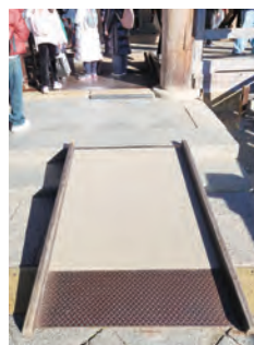
入口に入ったら、スロープが設置されています。

これからも、車椅子の方でも安心して行けるような観光地がもっと増えていけばいいと思います。