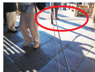
入口に入る前に、段差がありますので、十分に注意してください。