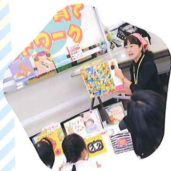
★子どもと一緒に 絵本を楽しむ