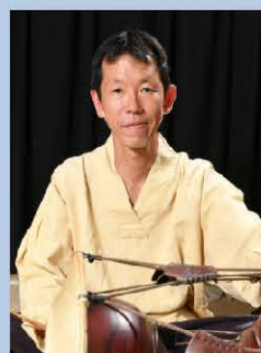
朴哲 (朝鮮半島伝統打楽器)