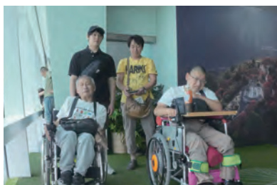
期待に胸膨らませて、いざ台湾…