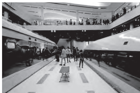
日本最大級の鉄道博物館『京都鉄道博物館』は2016年4月オープン。

鉄道ジオラマを眺めたり、SLスチーム号に乗ったりして、入場料は少し高かったけど、いろんな体験が出来て良かったです。小さい頃から鉄道が好きで、これまで旅行がてらに北海道から九州まで全国各地にいろんな鉄道に乗ってきました。地元で鉄道博物館が出来るととても嬉しかったです。また機会があれば行こうと思っています。