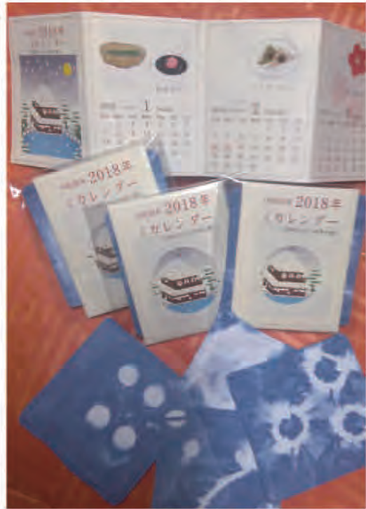
藍染め布付携帯サイズカレンダー(年度代わり対応-2019年3月迄)