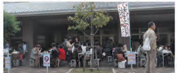
ソフトの人気はすごい・・・寒くてもOKです。

希望の家は東九条にあり、2年前は大バザーでしたが、昨年秋まつりに名称が変わりました。例年より店が多く出て、お客さんも多かったようです。子供さんがわた菓子やシャボン玉を買ってくれて良かったです。ソフトクリームは寒くても40個以上を売り上げて、完売とは行きませんでした。こちらも大健闘。ほかの物も、よく売れました。