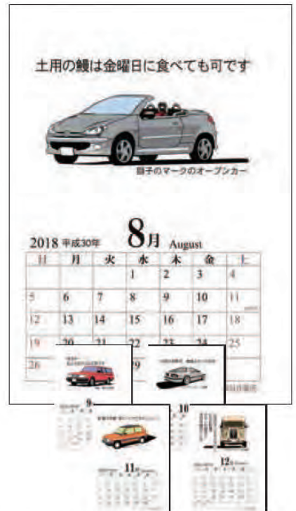
卓上カレンダー(ハガキサイズ縦型・スタンドケース入り)