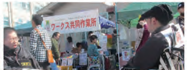
ワークスの看板商品の一つ、わた菓子はこの日も大人気。