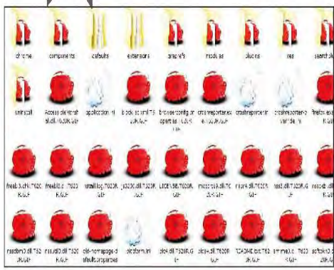
(たこいかウイルス)

感染ルートは、いろいろありますが、メール・USB・CDR 等以外にこのごろはホームページを見ただけで感染する。可能性が高くなり。やっぱり、ウイルスソフトを入れなければなりません。でも、ソフト購入と毎年の更新料を考えると・・・・・・・・