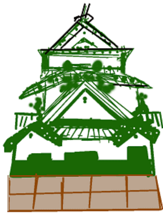
彦根城の絵（岩本永子作）