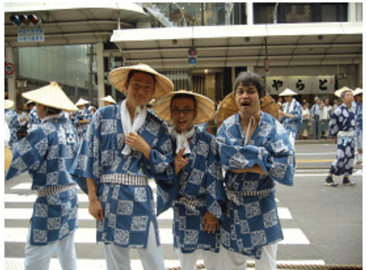
↑3人で写っています。